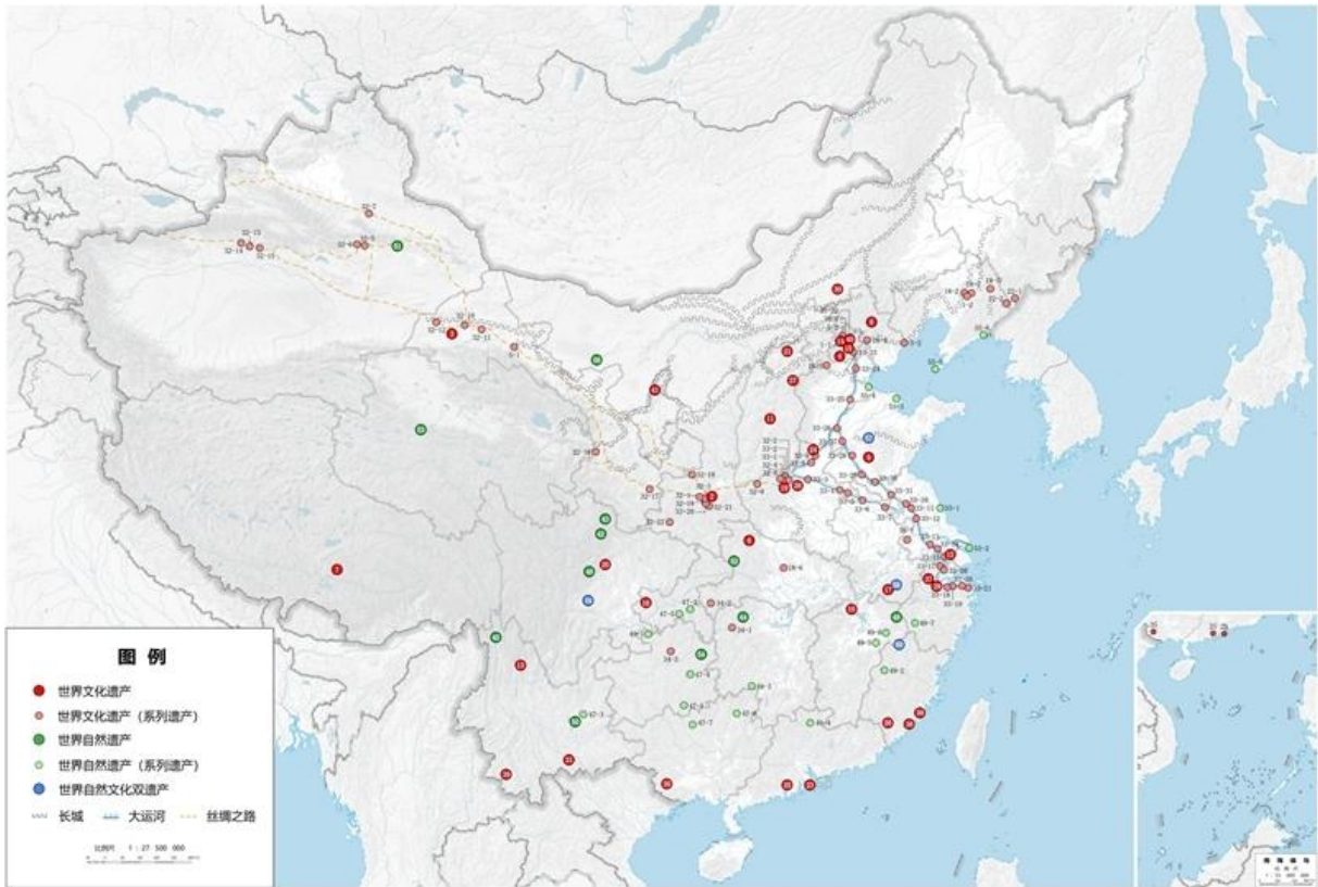
图 2 中国世界遗产分布图