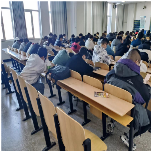
图2 部分学生玩手机